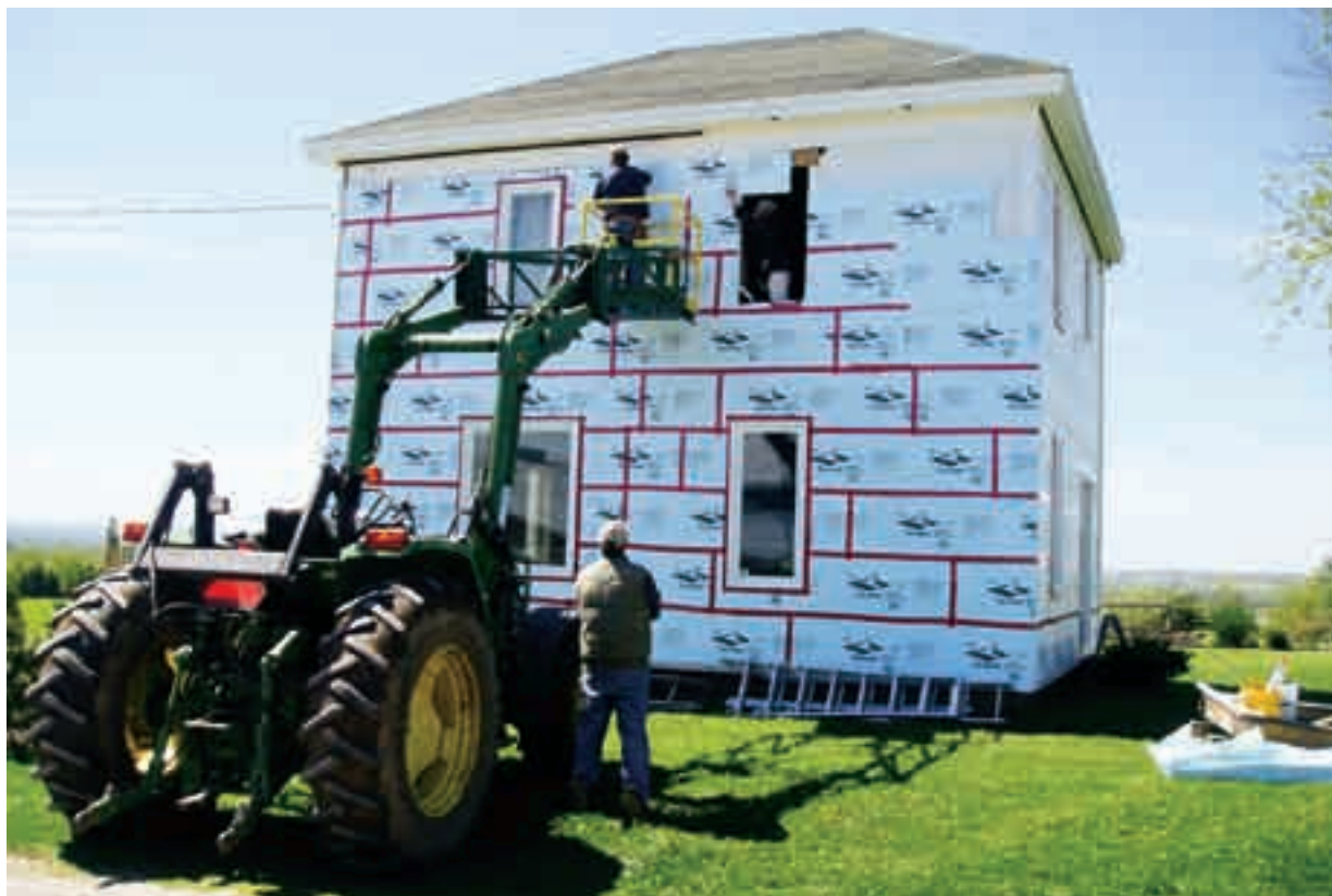
Notre grand gagnant, Andre Van Agten, a réduit de 18,5 % la consommation énergétique de sa maison de 2006 à 2007.

le plus fort pourcentage de réduction dans chaque usine et dans l'ensemble de l'entreprise.